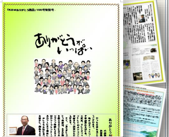
2002 年(平成 14 年)2 月 ありがとうございます 第 100 号

毎月欠かすことなく発行を続けることができましたのも皆様のおかげ様です。心より御礼と感謝を申し上げます。ありがとうございます。