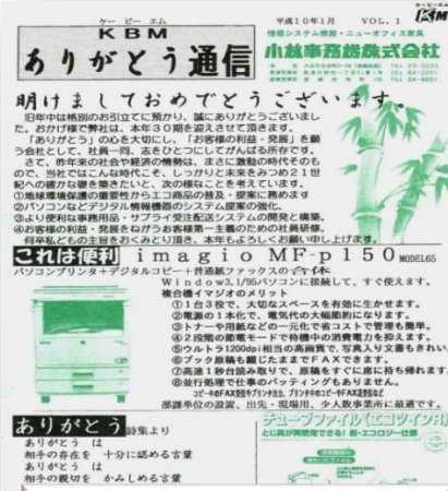
1998 年(平成 10 年)1 月 ありがとうございます 創刊

KBM ありがとうございます通信「ありがとうございます」の創刊は 1998 年 1 月。 皆様にご愛読いただき、今月号で 300 号の発行となりました。