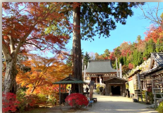
観音正寺の紅葉 11月撮影