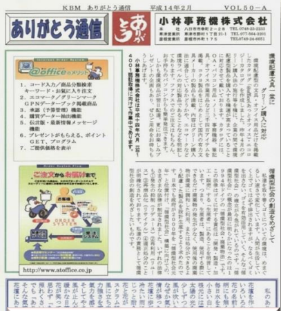
2002 年(平成 14 年)2 月 ありがとうございます 第 50 号