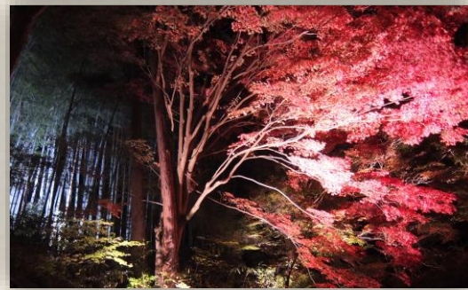
教林坊のライトアップ紅葉 11月撮影