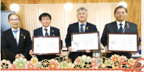
永年勤続 30 年おめでとう！

今年は勤続 30 年のベテラン社員 3 名、勤続 20 年の社員 2 名、勤続 10 年の社員 4 名の合計 9 名が表彰されました。結婚・育児・介護などプライベートとキャリア形成が両立できる会社環境・企業風土を大切にし、働きやすい・働き続けられる企業を目指していきます