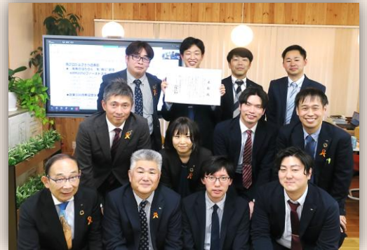
『未来のはたらく』を“共に”創る KBM2050 ファーストステップ プロジェクト（パーパス作成プロジェクト）