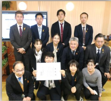
創業 100 周年記念ランチパーティ & 社員旅行実行プロジェクト