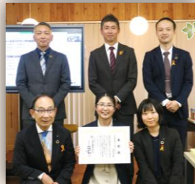
KBM 本社ルールガイドブック作成委員会

創業 100 周年及び新社屋建築に際して、様々なプロジェクトが発足し、各メンバーが通常業務と兼業しながらも、「働き方改革」や「Working Live Office」のオープン等、大きな成果を上げてくれました。ありがとうございます。