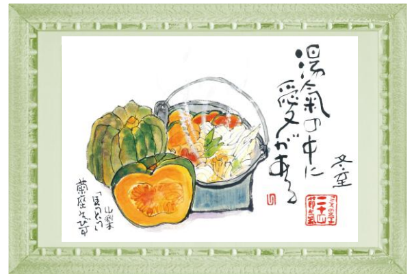
2025 年満福暦 12 月：落合勲先生 書画