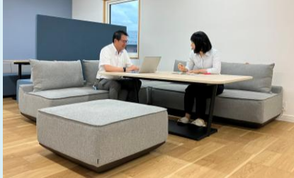
コクヨ: METTI (メッティ) + Region (リージョン)

今月は、【アイデア出し・情報整理・知識共有ブース】として活用している2階のソファースペース【METTI(メッティ)】をご紹介します。このソファースペースは以前、ご紹介した【brackets(ブラケット)】よりも、リラックスした雰囲気でのアイデア出しや情報整理等ができます。集中議論モードの時は背を立て、リラックスモードの時は背を少し倒して利用できます。