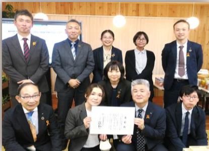
KBM グループ本社新築に伴う ABW/DX 化プロジェクト

「創業 100 周年」と「本社新築事業」への貢献 ありがとうございます：プロジェクト表彰