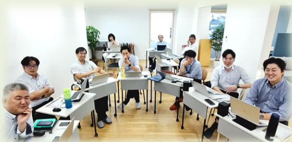
ミーティング風景