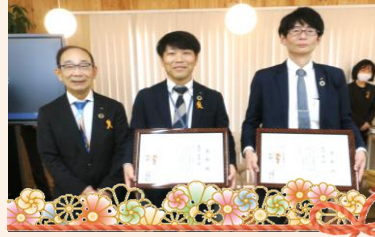
永年勤続 20 年おめでとう！