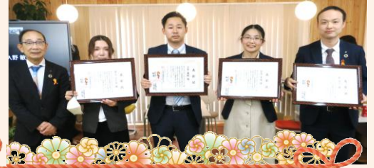
永年勤続 10 年おめでとう！