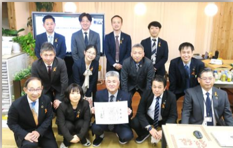
KBM グループ創業 100 周年並びに本社新築落成式プロジェクト