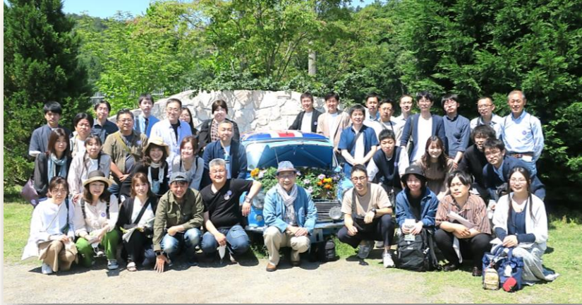
※感染症対策を徹底し実施しました。集合写真の撮影時のみ、マスクを外しています。

午後からは、彦根市方面・長浜市方面に複数コースを設定し、少人数でのグループ行動としました。