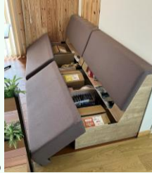
ITOki: ネットワーク収納付ソファ (ローバック)

腰を左右にスイングさせて気軽にストレッチできるswingy (スイングィー)。左右に運動しても頭の位置は変わらないので、会話やパソコン作業をしながら運動することもできます。