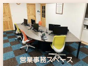
営業事務スペース

これからのオフィスには、快適で心地よい職場環境づくりが欠かせません。業務に適したスペースの設計や最適なレイアウトの採用、新しい家具の導入に加え、グループウェアの活用によって情報交換がより活発になり、生産性の向上と円滑なコミュニケーションが実現します。 当社では、自宅にいるような温かみと安心感を感じられるストレスフリーな執務環境を目指しています。 当社の『ライブオフィス』を、ぜひ職場づくりの事例としてご覧ください。