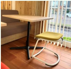
ITOki: スイギー (ロータイプ)

新社屋 Live Office では、フリーアドレス・ABW (Activity Based Working) の分類により、活動に応じた Working スペースとオフィス家具を選択しています。もっとも生産性が上がる Working スペースを各自が自主的に選択できます。