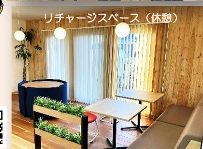
リチャージスペース(休憩)