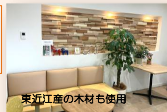
東近江産の木材も使用

フリーアドレス(ABW)を採用、営業職・技術職を中心に、自由に席が選択でき、当日コミュニケーションを取りたい人の隣に着席して、所属部署を超え、フレンドリーに情報の交換ができます。