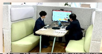
マイク・スピーカーを装備したサウンドソファ

2F のミーティングルームでは個別デスクが採用され、ミーティングに応じて、レイアウトが自由に行えます。 リモートミーティングでは、「サウンドソファ」や「MAXHUB」などを通じて、参加者の音声や映像を見ながら交流や議論でき、一体感が高まります。多様なミーティング環境が構築・選択可能です。