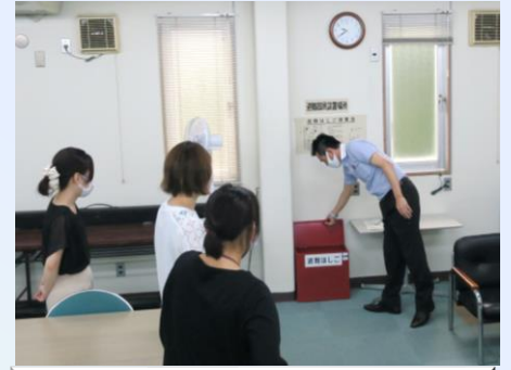
避難梯子の確認(本社2階)

今回は実際に非常ベルを押しての消防署への通報訓練、消火器については実際に水消火器を使っての消火訓練を行い、防災意識の高揚と、いざという時に対応できる訓練を行いました。技術営業メンバーはメンテナンス室に設置されている洗浄液の緊急時対応手順の読み合わせと、消火用砂バケツの位置などの確認を行いました。