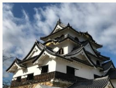
左 国宝 彦根城天守、附櫓及び多間櫓 中央 重要文化財 彦根城西の丸三重櫓及び続櫓 右 重要文化財 彦根城太鼓門及び続櫓