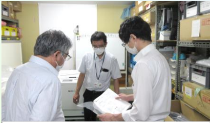
緊急時対応手順の確認 (草津支店)

9月1日(木)の9:00~緊急事態対応訓練を実施しました。緊急時対応手順の試行(訓練)により緊急時の対応手順書の有効性を再確認すると共に、地震や火災発生時の消火、通報、避難方法の確認を行いました。