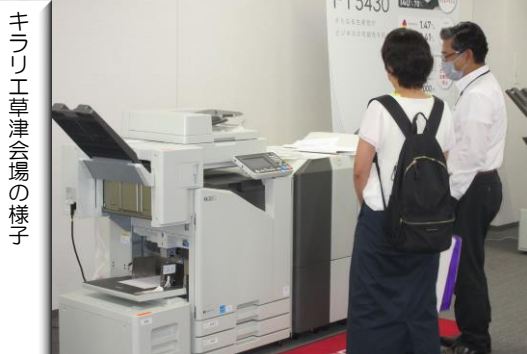
キラリ工草津会場の様子