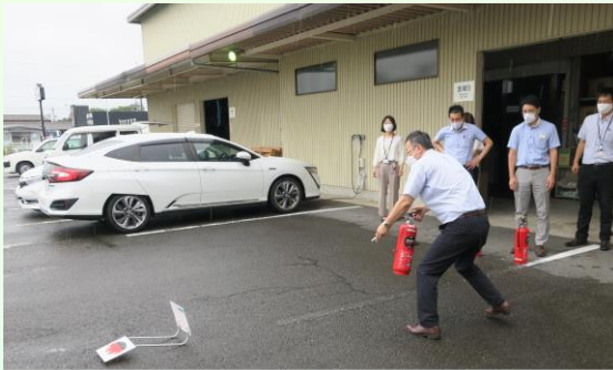
水消火器にて消火訓練(本社)