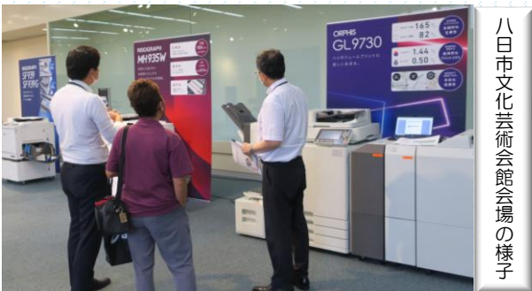
八日市文化芸術会館会場の様子

9月14日(水)八日市文化芸術会館にて、翌日の15日(木)はキラリ工草津にて、新型コロナウイルス感染症対策を徹底し、完全予約制の個別デモ体験会を開催いたしました。with コロナ時代に対応し、生産性向上、働き方改革へのご提案や生産性向上に関するソリューション商材を多数展示いたしました。ご来場、ご協力賜りました皆様に感謝申し上げます。ありがとうございます。