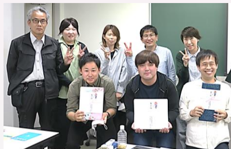
団体表彰 入賞者 (1位、2位、3位)