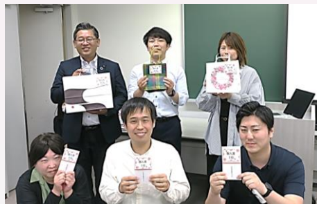
個人表彰 入賞者 (1位、2位、3位、10位、20位、30位)