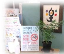
2020年4月1日より敷地内全面禁煙