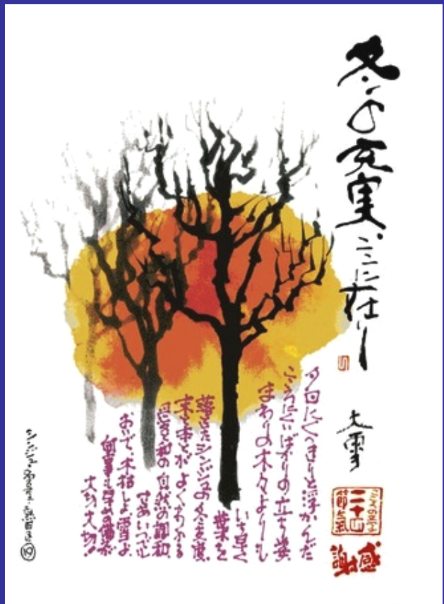
落合勲先生の「こころの文字 二十四節氣」より