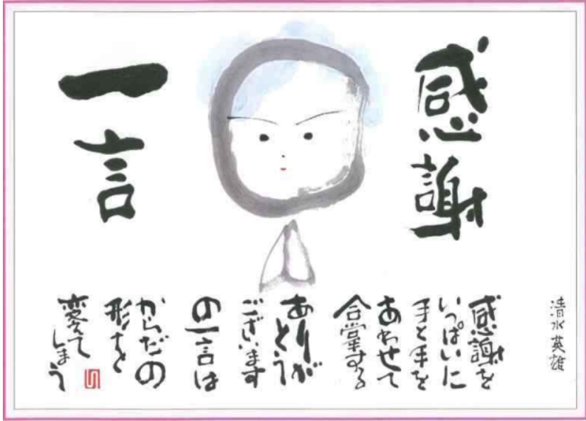
こころの文字 落合 勲 書画

堀井家は、麻布の行商からやがて、酒・醤油の醸造業の出店を設けた近江商人でしたが、明治には出店先を閉鎖し帰郷しています。明治16年(1883)、堀井家に入った新治郎は製茶などの指導をする役人でしたが、当時の事務文書の作成が非常に煩雑であったことから、何か簡便な方法を開発する必要性を痛感していた時に、シカゴの万国博覧会で「エジソンのミネオグラフ」と出会ったことが発明のきっかけとなったのです。帰国後は、染物の置型の捺染法にヒントを得て強力な雁皮紙に蠟を塗り、鉄筆で文字や図形を描く方法が完成し「謄写版」と命名しました。平成10年には郷里に旧邸が「ガリ版伝承館」として開館されました。現在デジタル化された「リソグラフ」などが、学校や官庁、オフィスで使用されています。(「近江商人に学ぶ」サンライズ出版から一部引用)